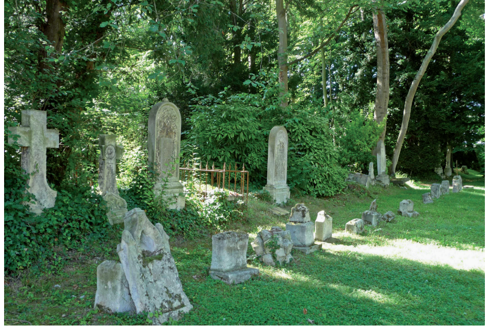
Stèles au centre du cimetière

Le cimetière se situe dans le centre-ville de Caen (au nord-ouest). A partir de la place Blot où se situe l'entrée du Jardin des Plantes, la rue Desmoueux conduit à la porte de l'ancien cimetière qui se trouve en face du N° 14.