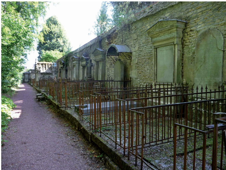
Caveaux sur l'allée périphérique sud

laisse deviner encore les anciens alignements. Partout la végétation envahit le moindre espace disponible et recouvre peu à peu les pierres couchées. L'endroit est très boisé, la végétation ornementale d'origine (ifs, buis, lauriers, thuyas...) a poussé librement et des hêtres, des frênes ou des tilleuls ombragent les allées.